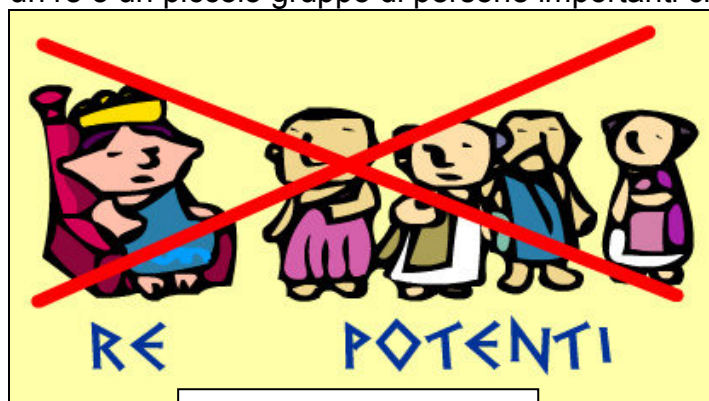
Non decidevano i più ricchi

Ad Atene non c'era un re o un piccolo gruppo di persone importanti che decideva per tutti.