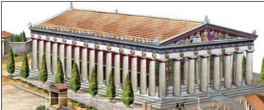
PARTENONE di Atene

FIDIA abbellì il Partenone con grandiose statue di marmo , in particolare quella della dea Atena che sembra fosse alta 10 metri e decorata con oro prezioso e avorio.