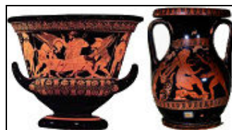
CRATERI in ceramica