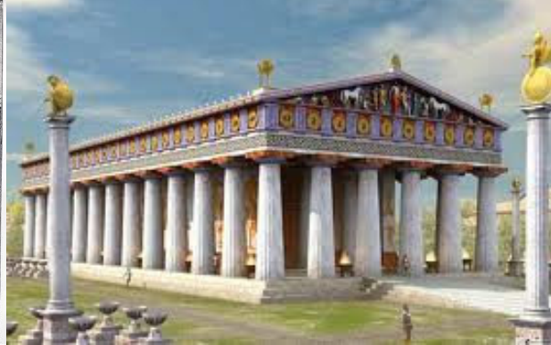
TEMPIO di ZEUS ad Olimpia

Il PARTENONE di Atene, in onore della DEA ATENA , è uno dei templi più antichi e famosi al mondo.